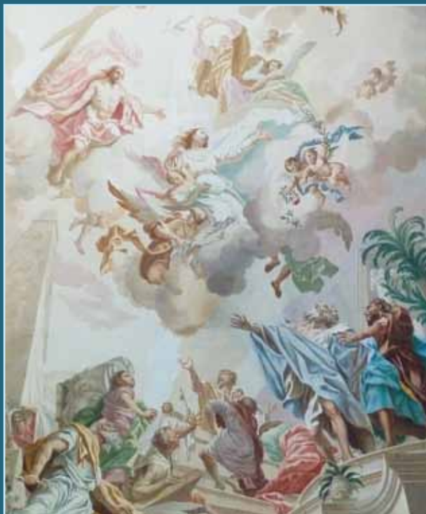
Deckenfresco: Himmelfahrt Mariens Pfarr- und Wallfahrtskirche Friedberg

Und nebenbei wird er ganz von alleine zu einem guten Gefühl des Aufatmens verhelfen, weil er die wunderschöne oberschwäbische Landschaft durchquert.